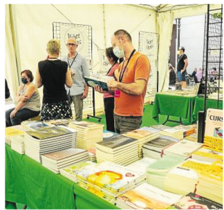
Los libreros vendieron 650 ejemplares en la 18 edición de la Fira del Llibre Ebrec.